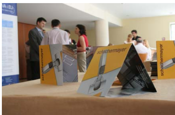
INFO-DESK U PREDVORJU KOFERENCIJSKE DVORANE