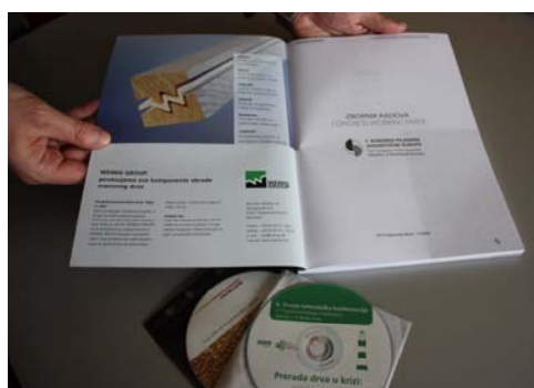
OBJAVA MATERIJALA U ZBORNIKU I NA CD-U