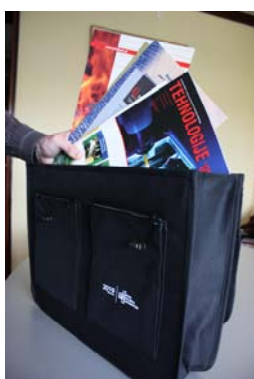
ULAGANJE INFO-MATERIJALA U TORBE ZA SUDIONIKE

Tradicionalno se očekuje velik broj sudionika, preko 250 drvoprerađivača, šumara, proizvođača parketa, građevinske stolarije i namještaja, prerađivača biomase, trgovaca drvom i namještajem, dobavljača tehnologija i repromaterijala, predstavnika sektorskih sajmova, sveučilišnih i srednjoškolskih profesora te predstavnika nadležnih institucija iz zemlje i inozemstva. Očekuje se prisustvo strukovnih udruga iz Bruxellesa te partnerskih udruženja i tvrtki iz Italije, Austrije, Njemačke, Bosne i Hercegovine, Srbije i Slovenije, a organizator namjerava kroz sponzorske pakete ponuditi prisustvo na konferenciji vodećim proizvođačima tehnologija i repromaterijala.